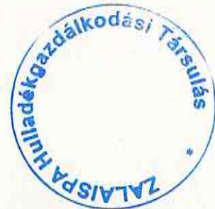
Bójte Sándor Zsolt a Társulási Tanács Elnöke